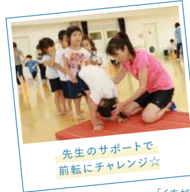
先生のサポートで 前転にチャレンジ☆

リズム室では「運動あそび」の真っ最中。マットやハードルを使った楽しい「サーキット」に、子どもたちは大はしゃぎ! コーチを務める「くまがレクラブ(平群町の総合スポーツクラブ)」専属のトレーナーは、「ケンケンで、あっちまで行くよ! 転ばずにできるかな!？」と盛り上げます。楽しい運動あそびを通して、「走る」「跳ぶ」「投げる」「蹴る」といった基本動作を身に付けさせていくのだそう。