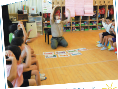
“おひさま”のジェスチャーと英語で「日曜日」を表現