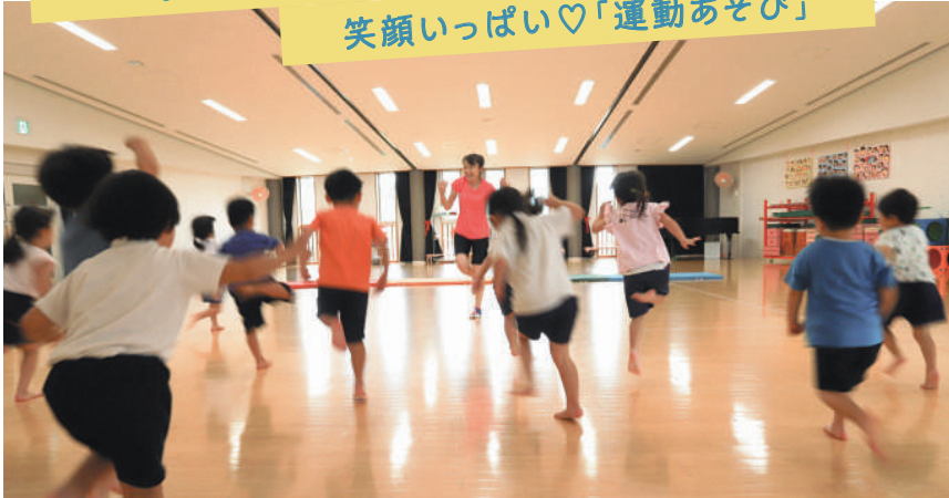
ケンケンでダッシュ! 脚力アップ、体幹、バランス力、身体の操作性が身に付きます