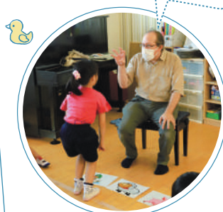
動物の当てっこゲームにTRY♪

5歳児になる頃にはみんなすぐく英語が上達しています。遊びながらだと自然に英語力が身に付くのでしょね!