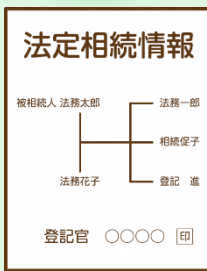
法定相続情報一覧図