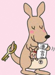
遺言書ほかんガルー

遺言書の内容については、 法律の専門家への相談 をお願いします。 遺言書保管申請の手続や書式は、 法務省ホームページ をご覧ください。