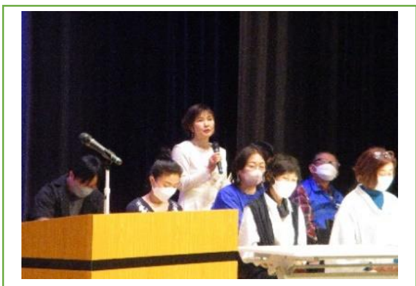
講師先生のご紹介