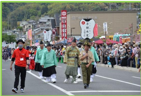
今年の主役の登場！