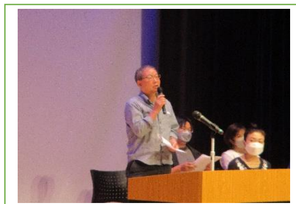
講師先生のご紹介