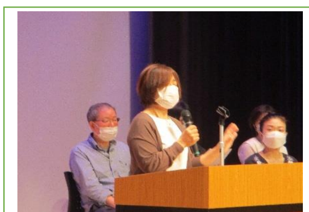
石原さんの体験発表