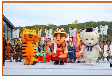
しぎとらくん たつたひめ 雪丸くん (信貴山)(三郷町)(王寺町)も応援に 平群駅前是人でいっぱい