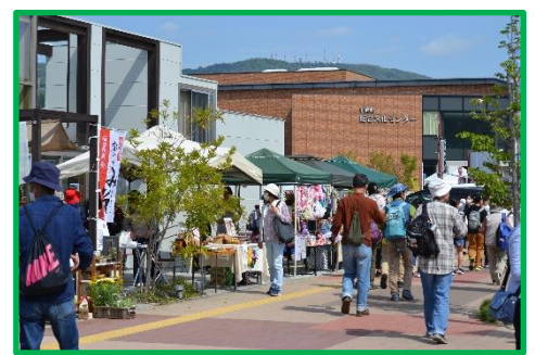
どれにしようか迷います