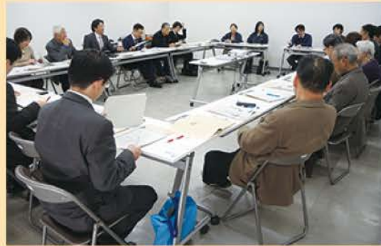
豊中市・豊中市社会福祉協議会視察の様子