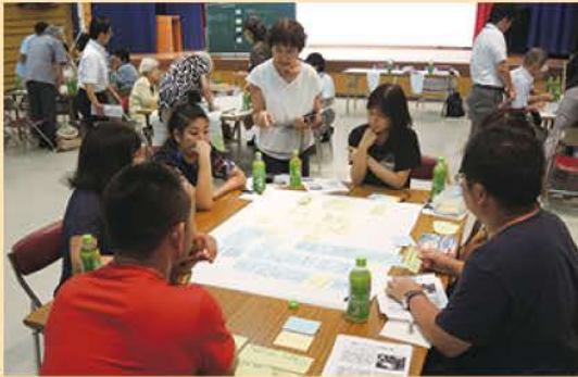
住民ワークショップの様子