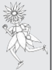
健康へぐり21 イメージキャラクター こぎくちゃん

とき 9月25日(金) 午前9時 近鉄生駒駅集合 午後3時頃 近鉄生駒駅解散 ※当日、6時50分のNHK気象情報で奈良県の午前中の降水確率が40%以上の場合は中止。