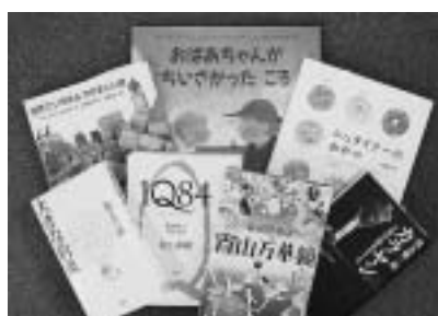
▲このほかにも、たくさんの 新しい本が入りました。