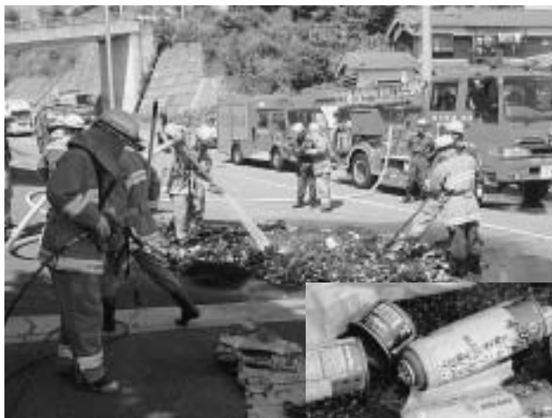
▲ 消火の様子と、火災原因となるスプレー缶等

7月15日、A地区粗大ごみの回収時に、ガス抜きをしていないスプレー缶・カートリッジ式ガスボンベ缶が原因と思われるごみ収集車の車両火災事故が発生しました。