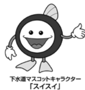
下水処理マスコットキャラクター「スイスイ」