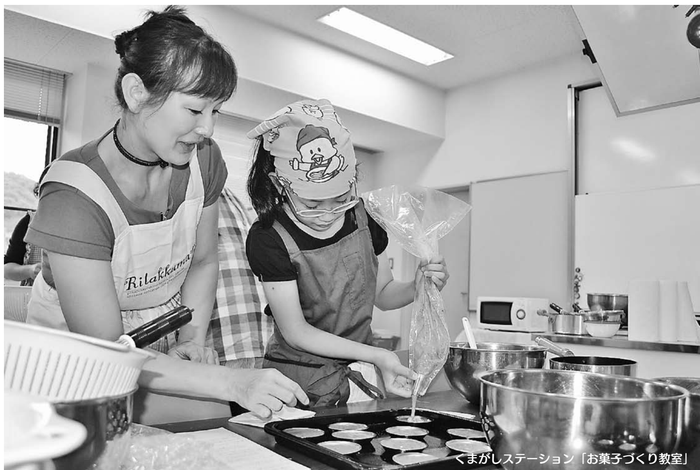
くまがしステーション「お菓子づくり教室」