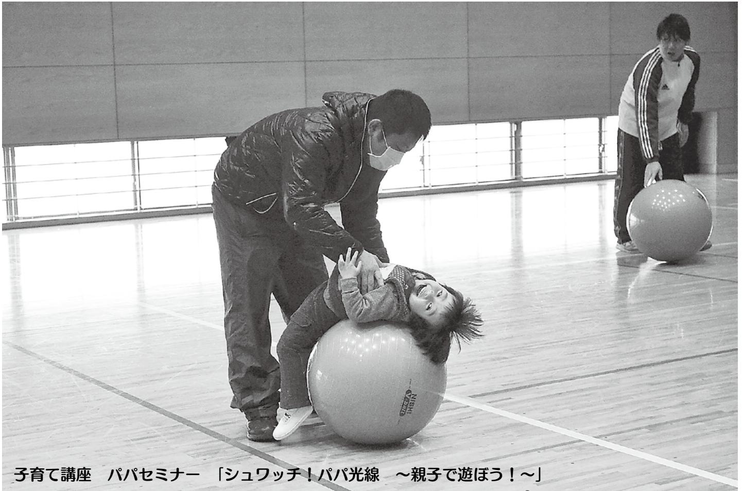
子育て講座 パパセミナー 「シュワッチ！パパ光線 ～親子で遊ぼう！～」