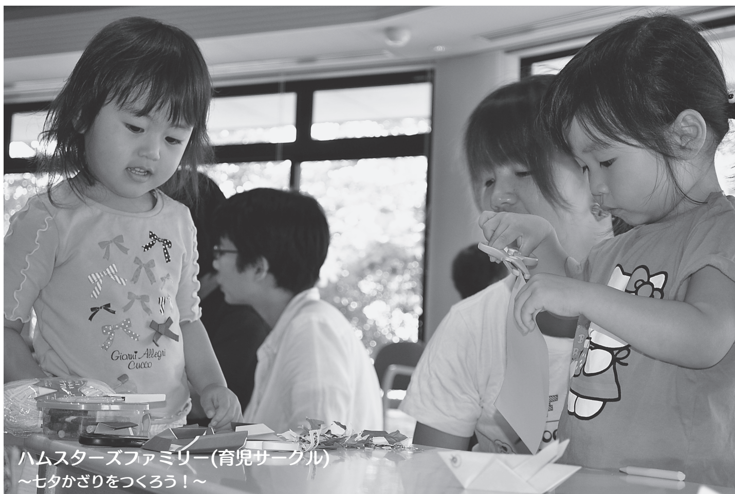
ハムスターズファミリー(育児サークル) ～七夕かざりをつくろう！～