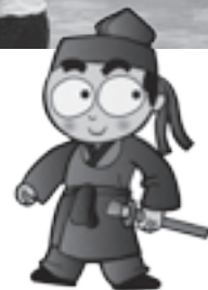
『親子のふれあい』 平群町ウォーターパーク