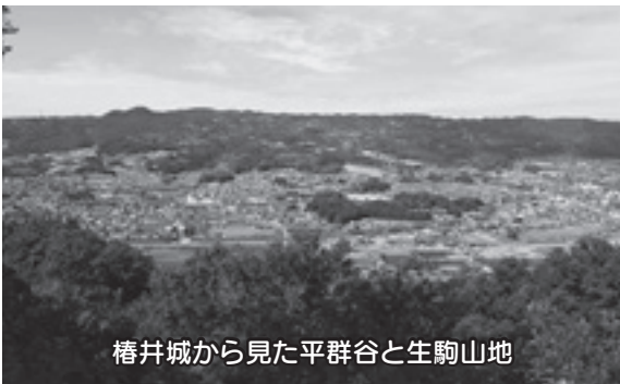
樗井城から見た平群谷と生駒山地