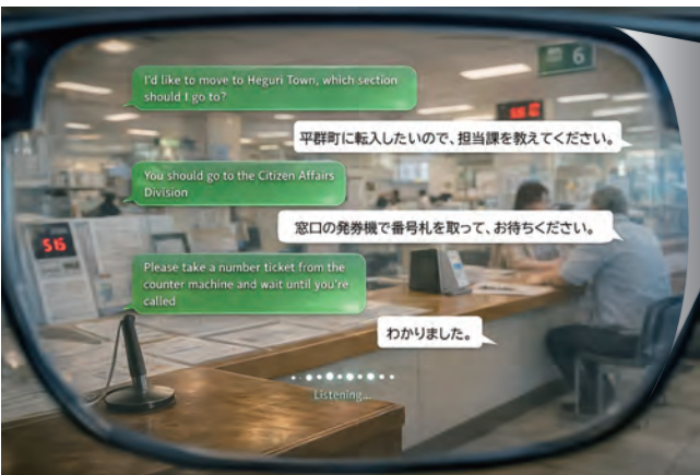
スマートグラス装着時表示画面イメージ