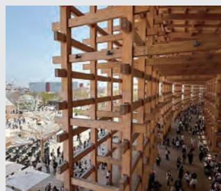
図 まち未来推進課

全国から多くの応募があった中で選定されたもので、万博の理念である「いのち輝く未来社会のデザイン」を次世代へつなぐ、たいへん意義深い取り組みです。町としても、地域資源を生かした持続可能なまちづくりにつながる取り組みとして、引き続き支援していきます。具体的な使用用途や活用の様子は改めてご紹介します。