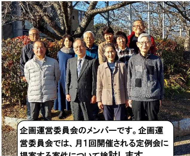
企画運営委員会のメンバーです。企画運営委員会では、月1回開催される定例会に提案する案件について検討します。